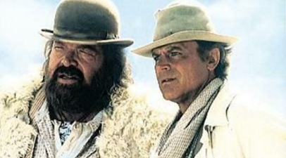
Als gutmütiger und schwerwichtiger Held in Actionkomödien gefangte Bud Spencer zu Weltruhm. Seine Wild-West-Schlagereien an der Seite des eisigkühlen Terrence Hill haben Kultcharakter.

Am 27. Juni 2016, heute vor einem Jahr, ist Carlo Pedersoli, die legendäre „Keule“ aus Filmen wie „Buddy haut den Lukas“ (1980) oder „Banana Joe“ (1982), im Alter von 86 Jahren gestorben.