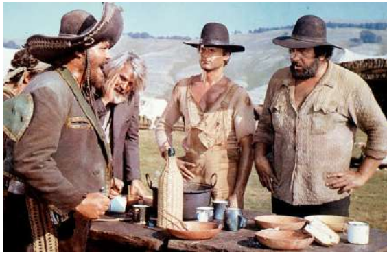
1976: Bud Spencer und Terence Hill in dem Streifen "Hector, Ritter ohne Furcht und Tadel"

"Es gibt auf der Welt überall diesen kleinen Mann, der sich mit seinem Beruf, mit schwerer Lohnarbeit, herumärgern muss, mit dem Chef, dem Alltag. Und wer würde diesem Alltag, diesem Anrennen gegen die Widrigkeiten, nicht gern mal eine Ohrfeige verpassen? Oder einen Faustschlag versetzen? Genau das habe ich als Bud Spencer gemacht."