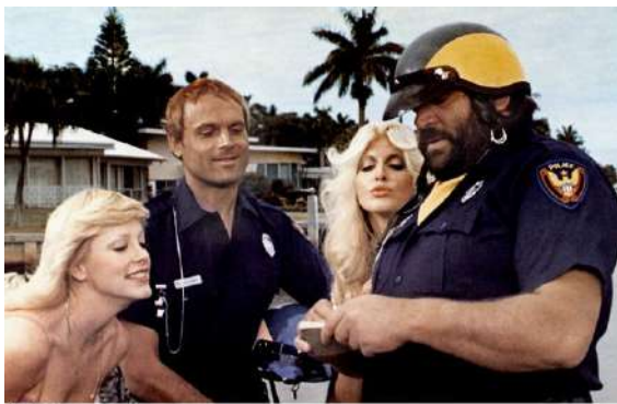
1977: In "Zwei außer Rand und Band" spielen die beiden ein Polizisten-Duo

Auch Pold musste kämpfen. 2008 schrieb er an seiner Diplomarbeit zum Thema Filmproduktion. Als Werkstück entstand der Trailer zu einem fiktiven Film über Bud Spencer. Was dann passierte, hatte er nicht erwartet: "Ich bekam Mails aus der ganzen Welt. Aus Japan, Südamerika, Südafrika und vor allem aus Deutschland. Alle wollten wissen, wann denn der Film in die Kinos kommt. So stellte sich die Frage, ob ich mir einen 40-Stunden-Bürojob suche oder mir einen Lebenstraum verwirkliche und den Film wirklich drehe."