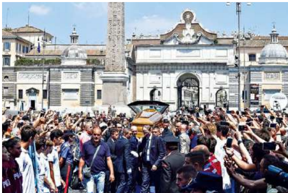
Der letzte Weg: Die sterblichen Überreste von Carlo Pedersoli werden über die Piazza del Popolo in Rom getragen, hunderte Fans stehen Spalier