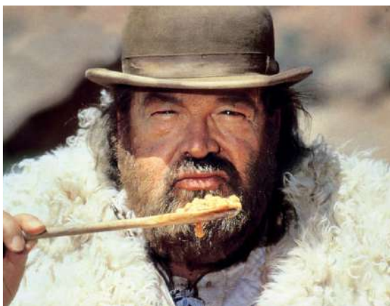
1994: Nach zehn Jahren Pause finden Hill und Spencer in "Troublemaker" zusammen

Er entschied sich für den Lebenstraum. Ein zähes Ringen begann. Was in den Spencer-Filmen die Bösewichte mit Sechstagebart darstellten, waren für Pold die heimischen Filmförderinstitutionen: "Sie haben das Projekt sechs Mal abgelehnt. Das komplette Drehteam arbeitete die ersten Jahre unentgeltlich. Ich hielt mich mit Jobs als Lastwagenchauffeur, Christbaumverkäufer oder Supermarktkassier über Wasser. Bei der Finanzierung der Dreharbeiten halfen drei Crowdfunding-Kampagnen. Ich konnte nicht warten, bis die staatliche Filmförderung mich unterstützt, da viele meiner geplanten Interviewpartner schon über 80 Jahre alt waren."