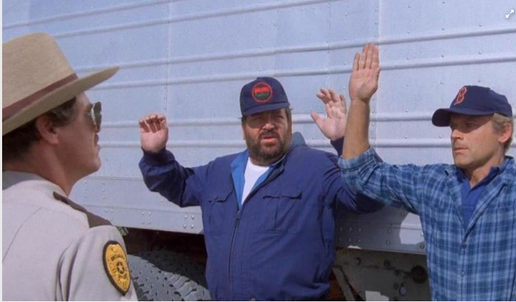
Woher rührte die Begeisterung für Filme mit Bud Spencer (M)?