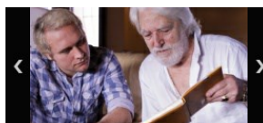
Sie nannten ihn Spencer (2017)