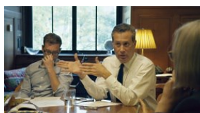
REGISSEUR: Frederick Wieseman